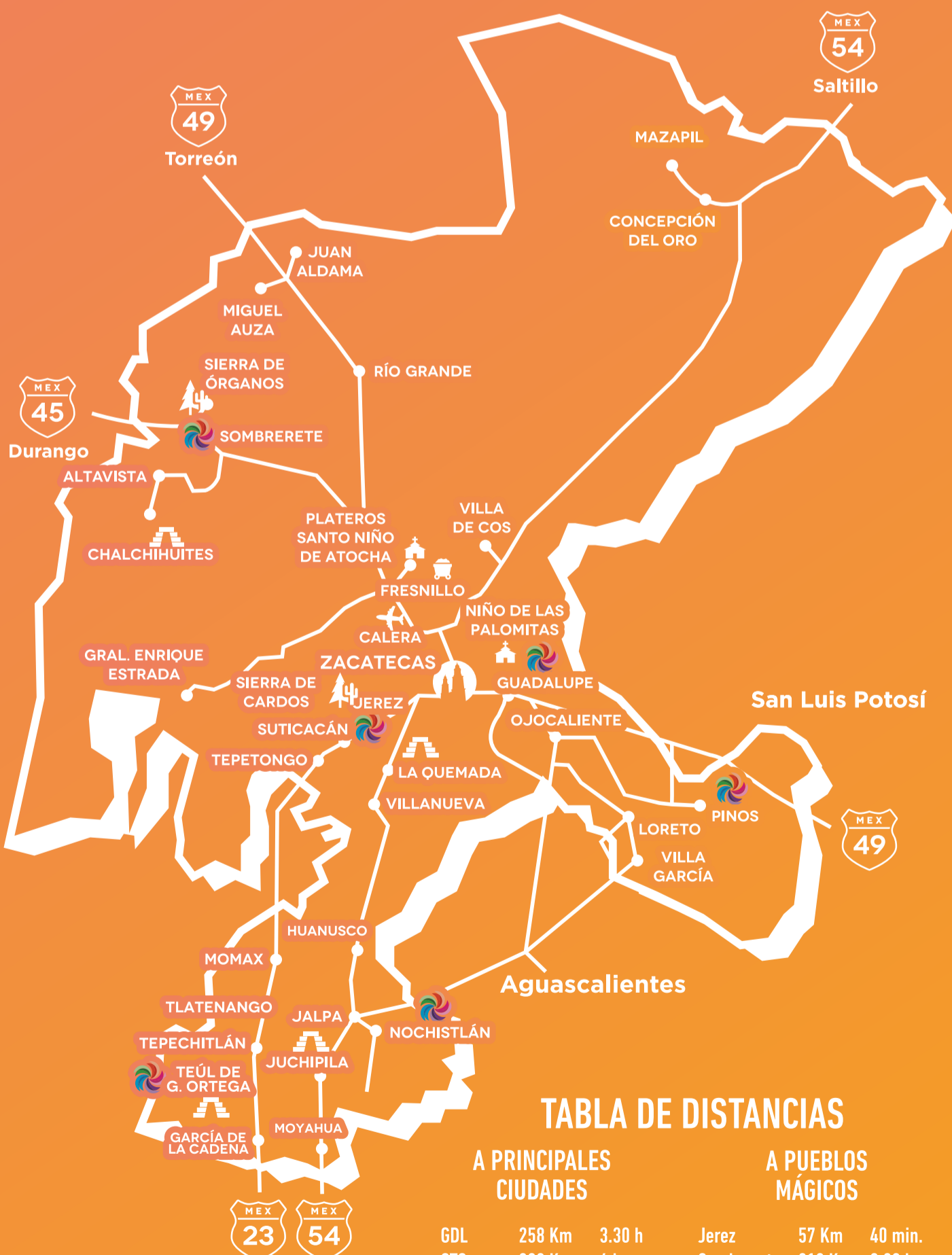
TABLA DE DISTANCIAS

Del centro de la capital se encuentran transportes colectivos directos a Villanueva con costos de $50.00 y podrás encontrar una cada 15 minutos.