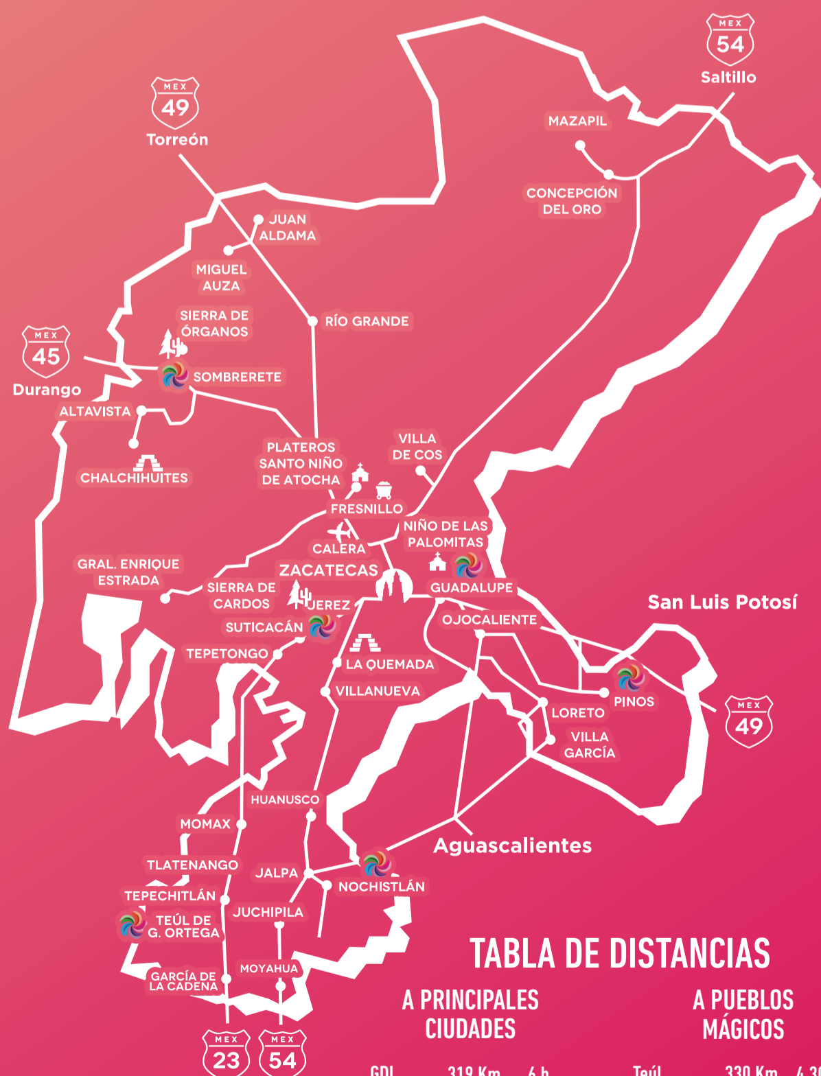
TABLA DE DISTANCIAS

Se encuentra a 170 km de la capital tomando la carretera federal número 45 rumbo a Durango, de la central de autobuses de Zacatecas hay salidas frecuentes hacia Durango, haciendo escala en este pueblo mágico, al igual que de Durango hacia Zacatecas.