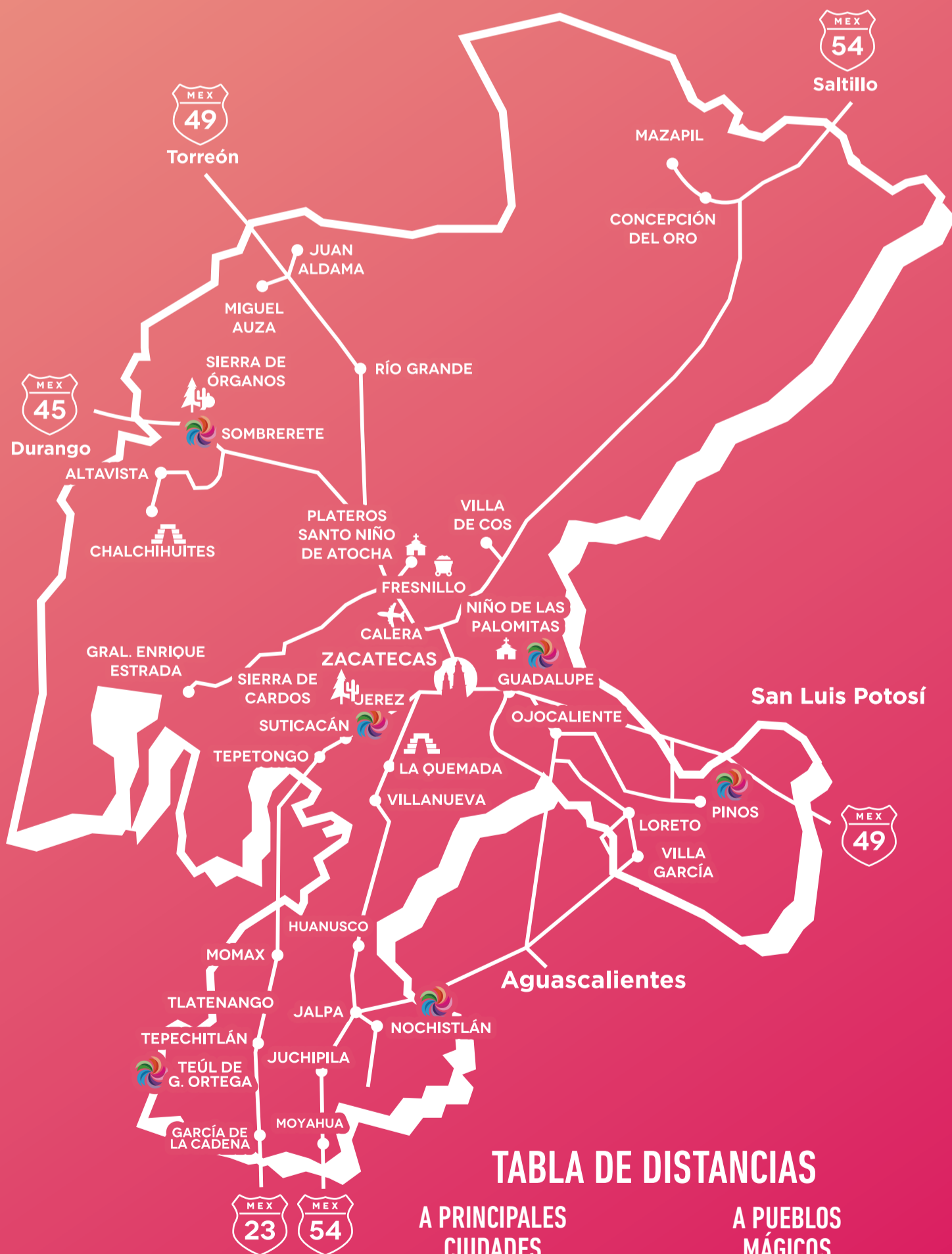
TABLA DE DISTANCIAS

De la central de autobuses de Zacatecas hay salidas frecuentes Hacia a Aguascalientes y de allí a Nochistlán.